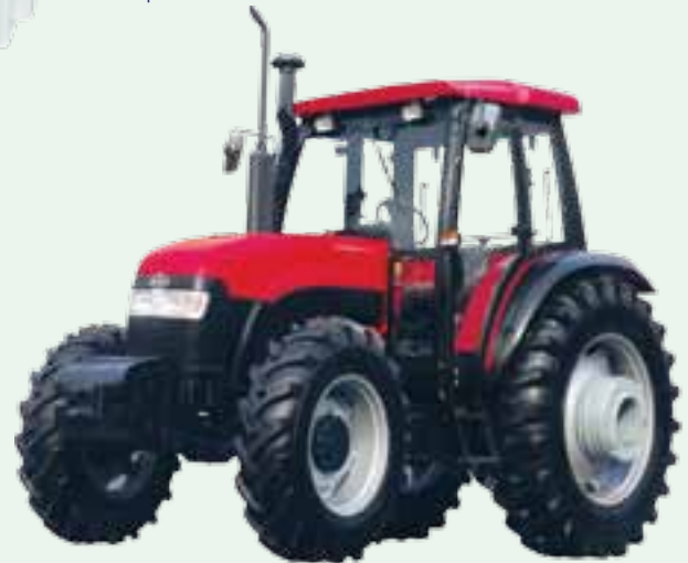
Tractors starting at $4600