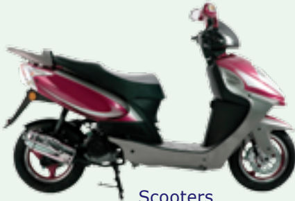
Scooters starting at $850