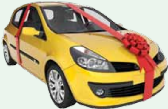
Automobiles from $7500