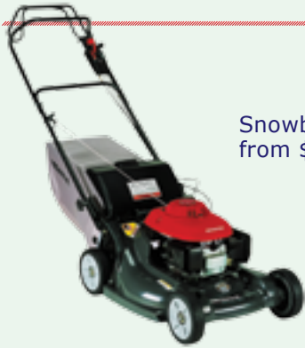
Lawnmowers from $230