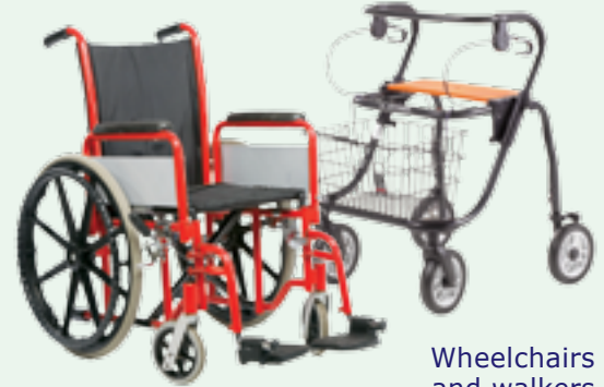
Wheelchairs and walkers starting at $130