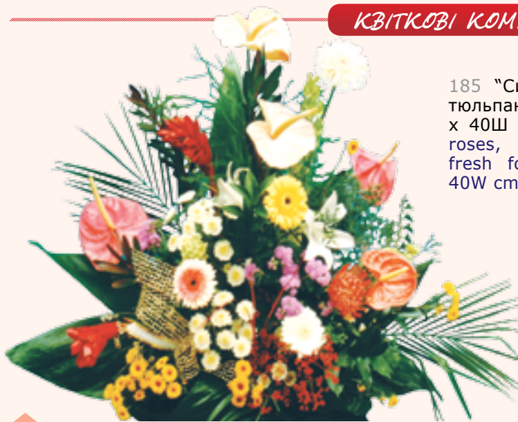
185 "Симфонія". Гербери, троянди, тюльпани, хризантеми, зелень. 50В x 40Ш см | "Symphony". Gerberas, roses, tulips, chrysanthemums, fresh foliage and accents. 50H x 40W cm.....$73