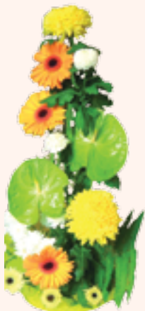
186 "Сонячна фантазія". Гербери, жовті троянди, хризантеми, зелень. 45В x 20Ш см | "Sunny Fantasy". Gerberas, yellow roses, chrysanthemums, fresh foliage and accents. 45H x 20W cm.....$75