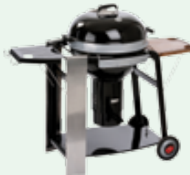
Barbecues starting at $90