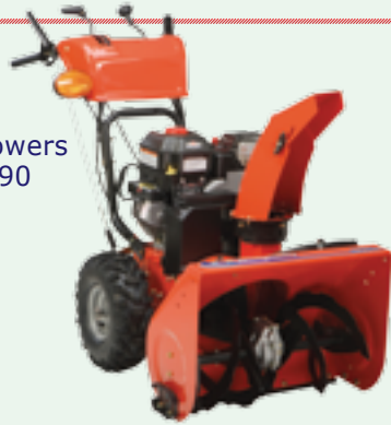
Snowblowers from $390